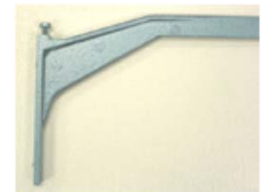
24-36Q MF arms